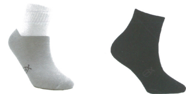
☞ 946 休閒襪/學生襪 白色/黑色 Size:M~L NT 380

簡約設計萊卡彈性紗包覆襪口舒適不緊繃 長時間穿著皮鞋時最好的選擇是最輕薄的襪款 讓雙腳享受舒服沒壓迫