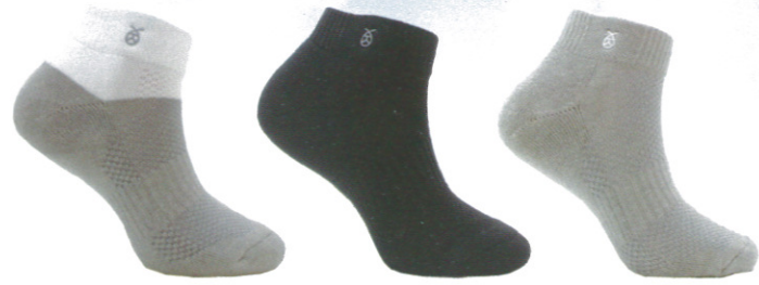
☞ 942 短筒運動襪/厚底 白色/黑色/淺灰 Size:M~L NT 380

堅持高科技奈米技術布料，腳底三圈底製作運動時減緩衝擊環形足弓設計包覆性最好、萊卡彈性紗，舒適在提升，舒貼透氣好穿最符合熱愛運動的穿著