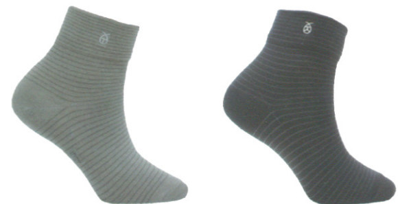
☞ 1057 條紋紳士短襪 淺灰/黑色 Size:M~L NT 380

平日休閒族的最愛簡單的色著搭配最優質的奈米銀絹竹炭材質，讓一雙簡單的襪子在性能上也感受提升，環形足設計包覆設計讓運動時也感受到舒適