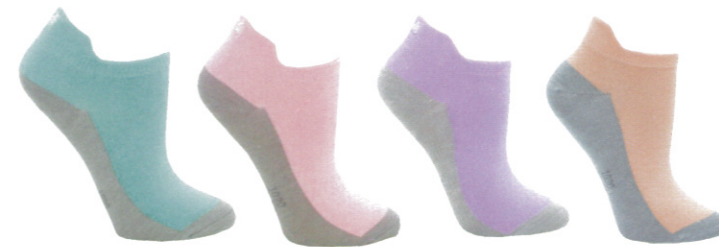
☞ 1030 造型船襪

襪口強化設計讓短襪不會在輕易鬆脫，腳弓環型設計在激烈運動時感受襪子緊緊包覆及保護雙腳，搭配最流行的襪款也能感受到雙腳倍受呵護般的感覺