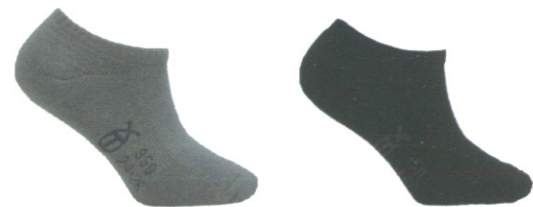
☞ 950 隱形運動襪/厚底 淺灰/黑色 Size:L NT 380

簡約的設計加上環形足弓設計包覆性最好、嚴選奈米銀絹竹炭與排汗紗結合，讓透氣排汗舒適在提升，舒貼透氣更好穿