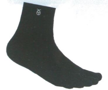
☞ 949 五趾短襪 黑色 Size:M~L NT 380

多款顏色可選擇，襪口設計在穩固不易脫落腳背也加長，讓運動時更加舒適腳底採用奈米竹炭紗，讓簡單的襪款也可以充滿各式花色可選擇