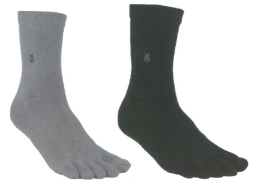
☞ 945 中筒五趾襪 淺灰/黑色 Size:L NT 380

環型足弓設計讓腳部的包覆性能加強，有腳跟設計讓襪子更服貼好穿，讓腳趾頭不會靠在一起，當流汗時不會感到濕黏不適