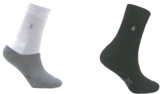
☞ 947 運動長襪/厚底 白色/黑色 Size:L NT 380

襪口強化設計讓短襪不會在輕易鬆脫，腳弓環型設計在激烈運動時感受襪子緊緊包覆及保護雙腳，襪底才用三圈底製作減緩運動衝擊，搭配最流行的襪款也能感受到雙腳倍受呵護般的感覺