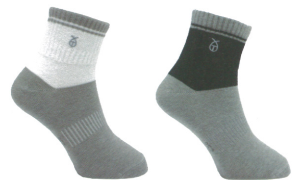
☞ 952 休閒兒童襪 白灰/黑灰 Size:S NT 380

環型足弓設計讓腳部的包覆性能加強，有腳跟設計讓襪子更服貼好穿，讓腳趾頭不會靠在一起，當流汗時不會感到濕黏不適