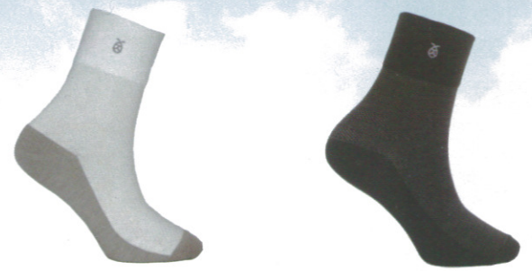
☞ 944 紳士襪 白色/淺灰/全黑色/格紋黑色 Size:L NT 380

堅持高科技奈米技術布料，腳底三圈底製作運動時減緩衝擊環形足弓設計包覆性最好、萊卡彈性紗，舒適在提升，舒貼透氣好穿最符合熱愛運動的穿著