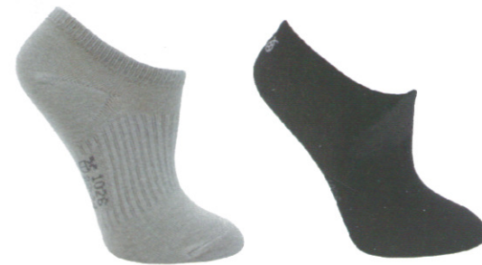
☞ 1026 隱形襪 淺灰色/黑色 Size:M~L NT 380

簡約設計萊卡彈性紗包覆襪口舒適不緊繃 長時間穿著皮鞋時最好的選擇是最輕薄的襪款 讓雙腳享受舒服沒壓迫